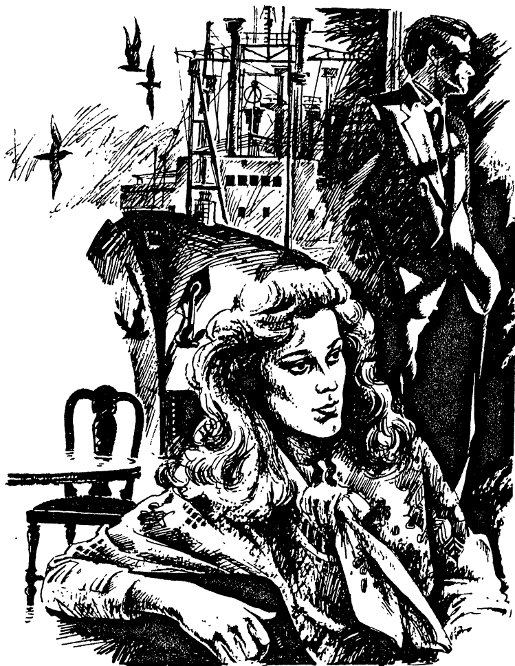
Рис. В. Родина.

жет быть, чтобы дважды направленная повестка не была получена?