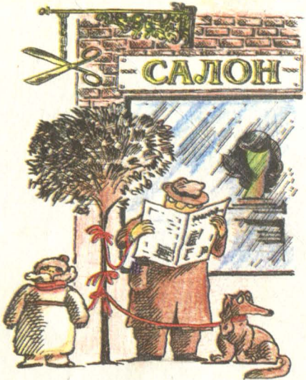
Рис. В. Хозина